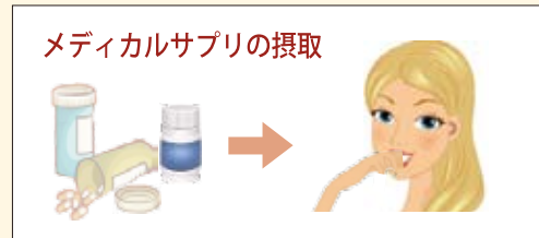
メディカルサプリの摂取