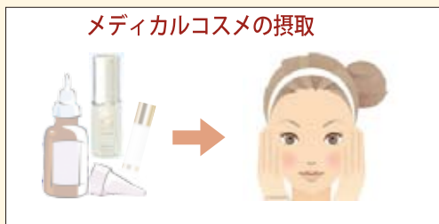
メディカルコスメの摂取